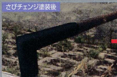
約30分で黒色被膜に変化。※乾燥時間3~4時間