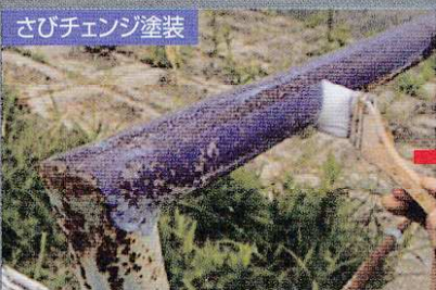
下地処理(3種ケレン)後にさびチェンジ塗装。

ご使用方法 下地処理は3種ケレン程度でOK! 塗装後は防錆効果を維持するため、上塗を施してください。