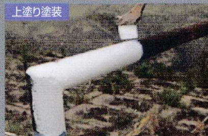
乾燥後、一般塗料で上塗り塗装。