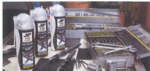
Superior Cutting Oil of Stainless, Steel, Aluminum, Titanium etc.