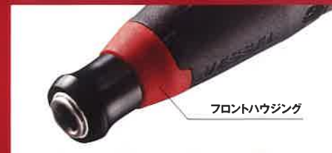
フロントハウジング