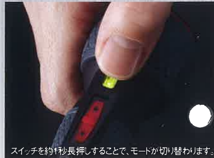
スイッチを約1秒長押しすることで、モードが切り替わります。