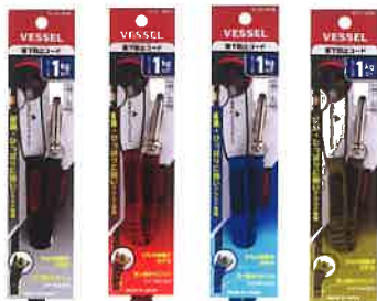
SC-W90K SC-W90R SC-W90B SC-W90D