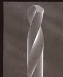
走査電子顕微鏡

超薄膜Purple Coatingを施すことで、 SJS加工に抜群の効果を発揮!